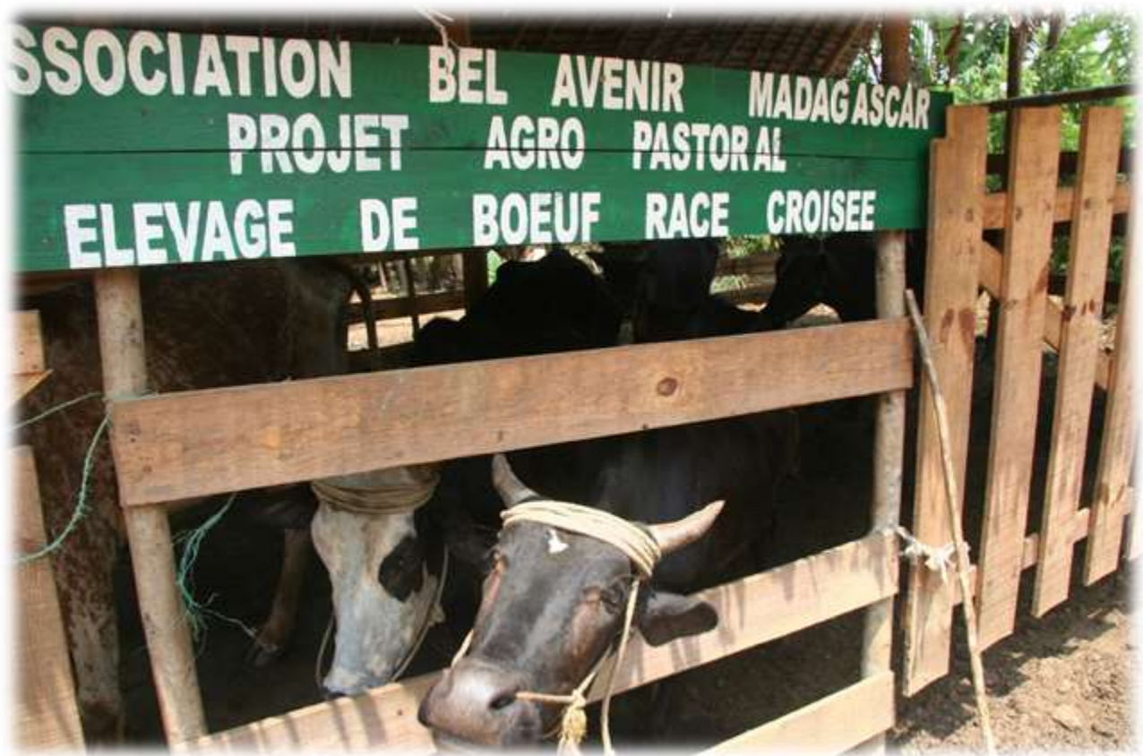
L'école, source du développement du milieu