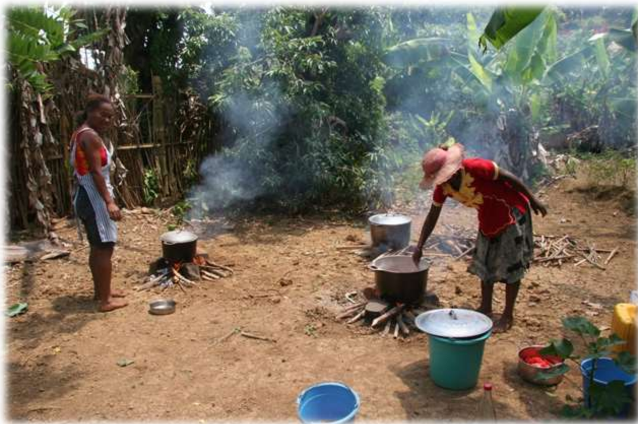
Rencontre des parents avec partage du repas; belle occasion pour fêter la rentrée scolaire de 173 enfants.