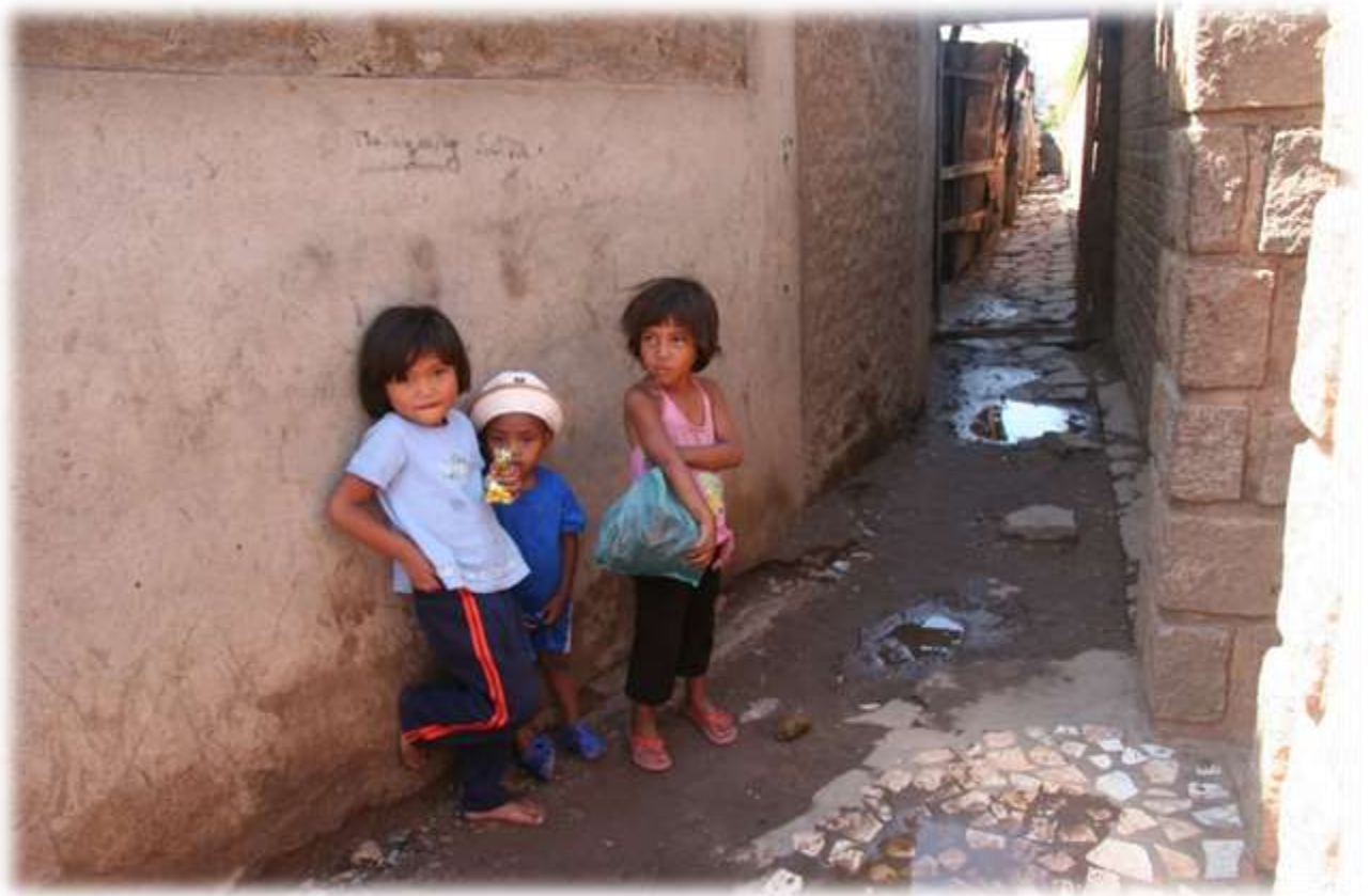
Ruelle du bidonville d'Anosibe, des enfants errent et mendient.