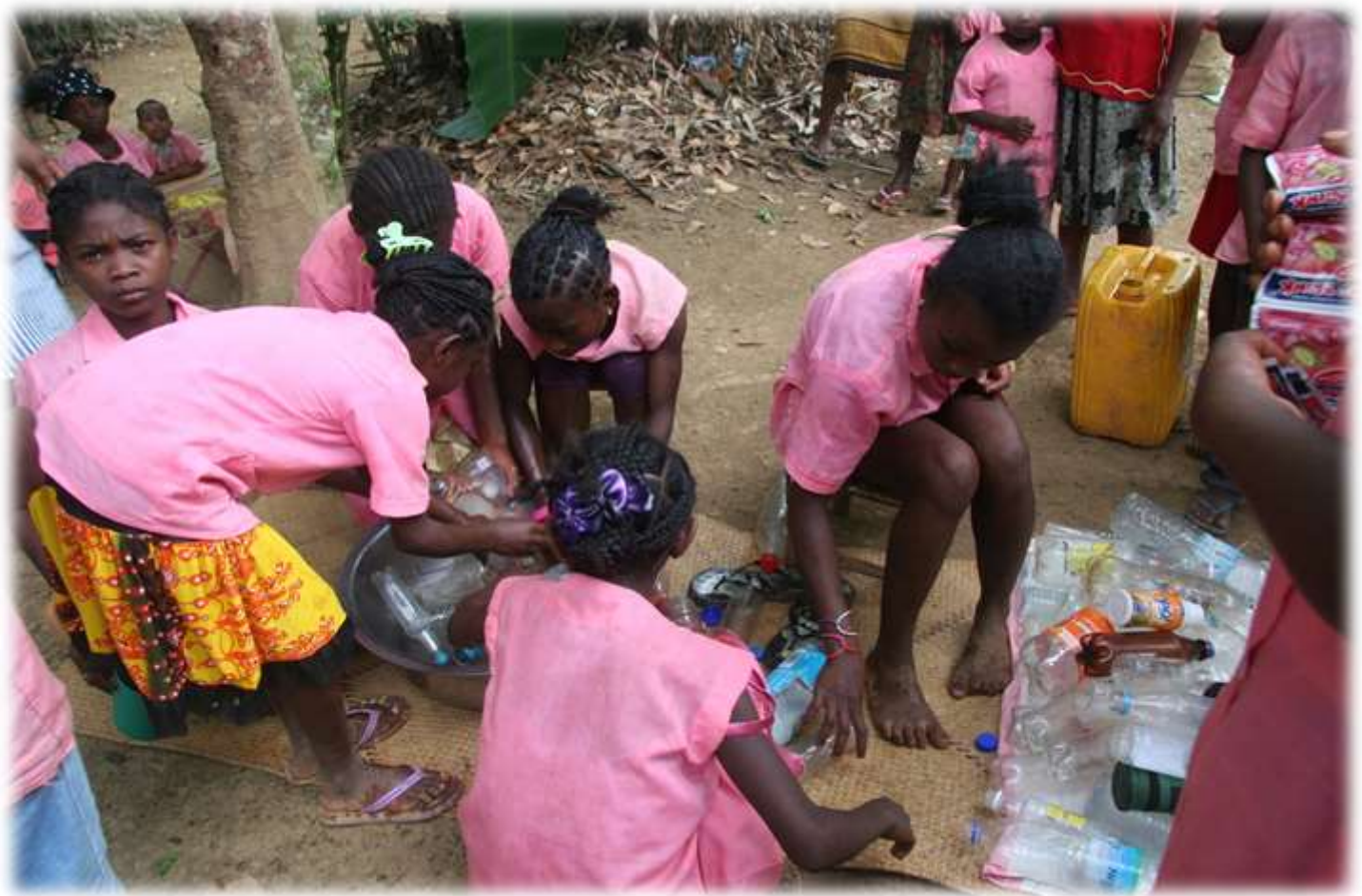
Le lavage des bouteilles de plastique pour les boissons et l'eau.