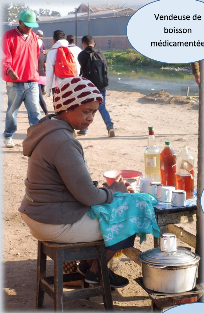
Vendeuse de boisson médicamenteuse