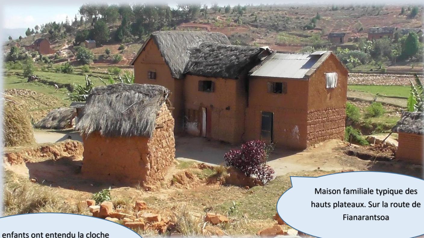
Maison familiale typique des hauts plateaux. Sur la route de Fianarantsoa

Les enfants ont entendu la cloche de l'église de brousse et viennent dans la cour de la nouvelle école.