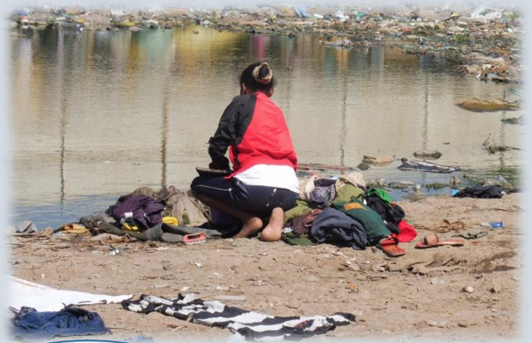
La pauvreté nous fait découvrir la qualité des regards, sans artifice.