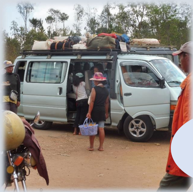
Sur la route de Tsiroanomandidy