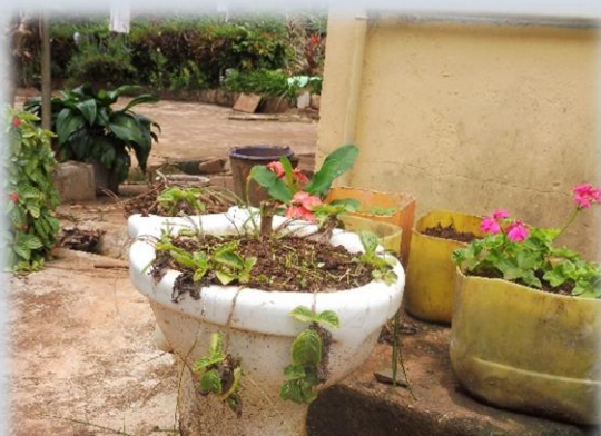
Le bol de toilette avant/après