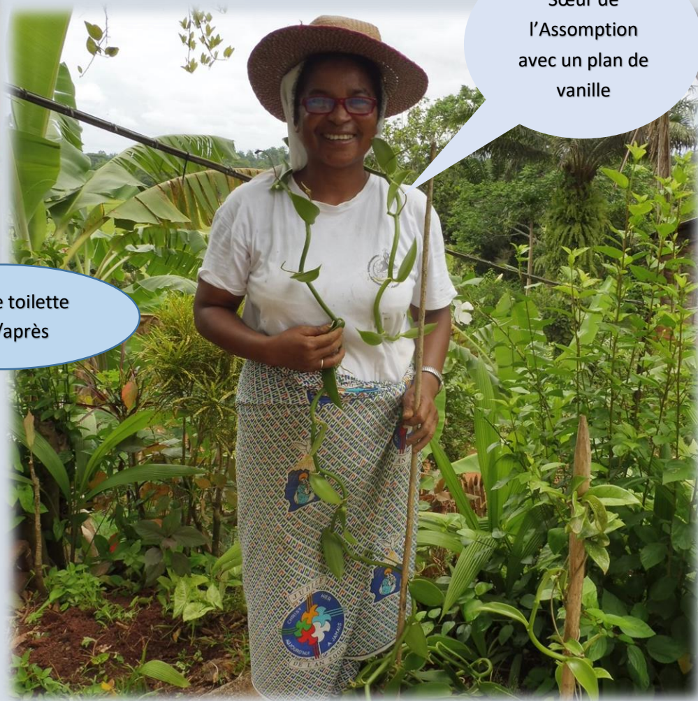
Sœur de l'Assomption avec un plan de vanille

Résumé terminé le 30 novembre 2018; envoyé aux membres du C.A. et par la suite à chaque donateur/donatrice.