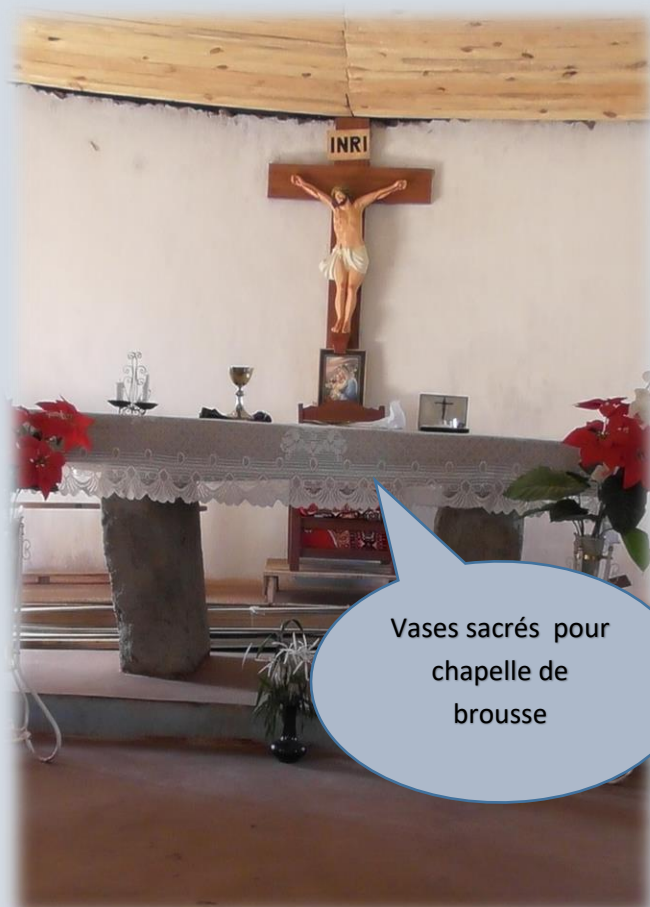
Vases sacrés pour chapelle de brousse