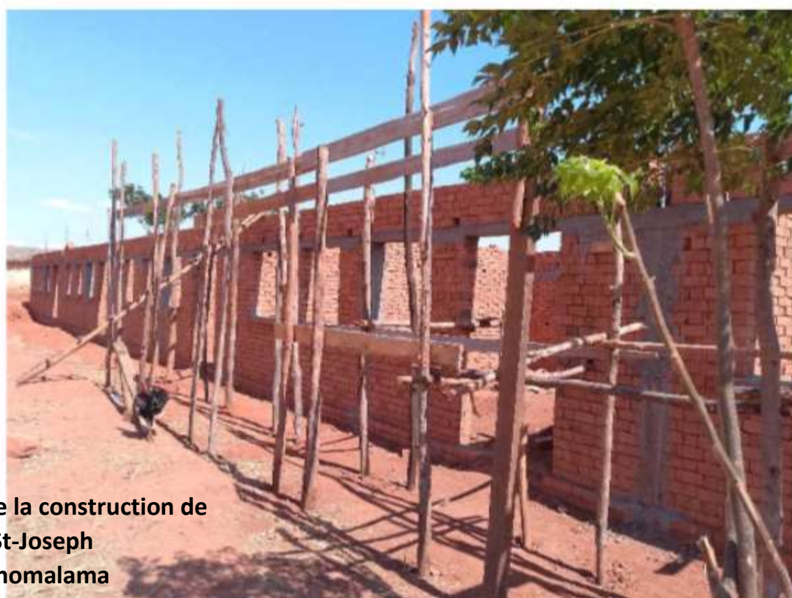
Début de la construction de l'École St-Joseph d'Andranomalama