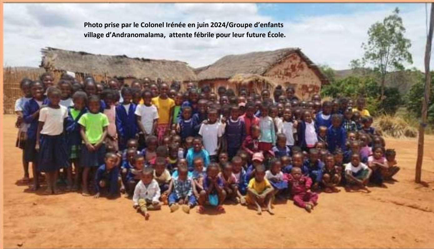
Photo prise par le Colonel Irénée en juin 2024/Groupe d'enfants village d'Andranomalama, attente fébrile pour leur future École.