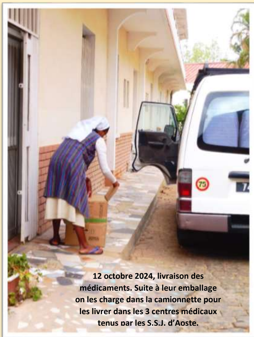
12 octobre 2024, livraison des médicaments. Suite à leur emballage on les charge dans la camionnette pour les livrer dans les 3 centres médicaux tenus par les S.S.J. d'Aoste.