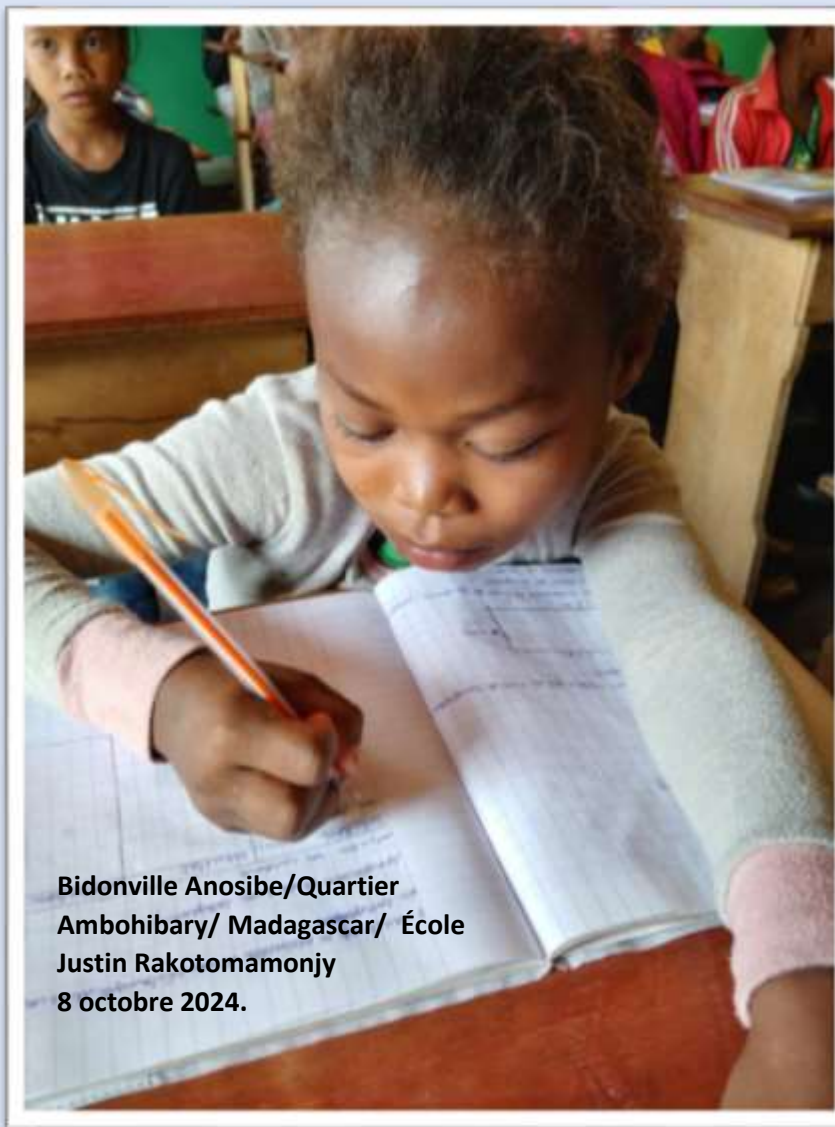
Bidonville Anosibe/Quartier Ambohibary/ Madagascar/ École Justin Rakotomamonjy 8 octobre 2024.

En dotant d'écoles, les villages les plus enclavés, nous travaillons à rééquilibrer la justice sociale. La faiblesse des petits, des humbles et la patience des parents, sont les guides de nos actions en brousse. Être proche des familles, inspire une attitude de respect avec la compréhension de leur vécu et ce, dans la dignité humaine.